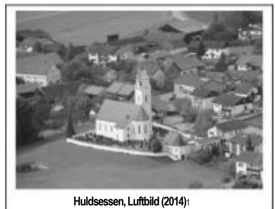
Huldessen, Luftbild (2014) 1

Huldessen war vor 1550 die größte Expositur des ehemals weit ausgedehnten Pfarrsprengels Oberdietfurt (zu dem auch die Expositur Massing gehörte). Die Expositurkirche St. Martin ist eine spätgotische Anlage aus der zweiten Hälfte des 15. Jahrhunderts. Sie war früher mit Ringwall und Graben geschützt, wovon heute noch einige Spuren (an der West-, Ost- u. Südseite) erhalten sind.