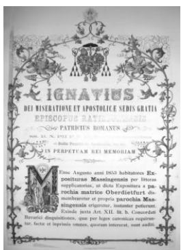
Gründungsurkunde der Pfarrei Massing von 1862