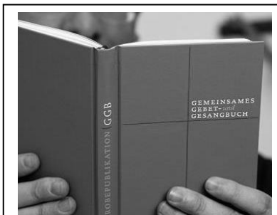
Vor Jahren wurde ein Probeexemplar des neuen Gotteslobs getestet.

Am 1. Adventssonntag 2013 soll das neue Gebet- und Gesangbuch (GGB) in allen deutschen und österreichischen Diözesen sowie im Bistum Bozen-Brixen eingeführt werden. Doch der Zeitplan ist ehrgeizig.