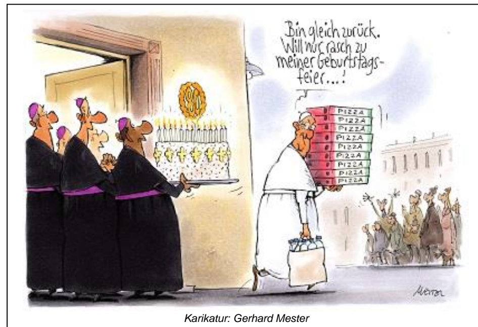
Karikatur: Gerhard Mester